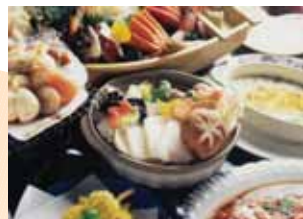
宿泊・飲み放題無しでお料理のみ の場合5500円(サービス料別)