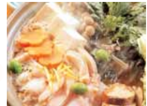
宿泊・飲み放題無しでお料理のみ の場合6500円(サービス料別)

宿泊宴会パックには、宴会料理、朝食付宿泊、2時間飲み放題、宴会場利用が含まれます (税・サービス料込)