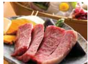
宿泊・飲み放題無しでお料理のみ の場合6000円(サービス料別)